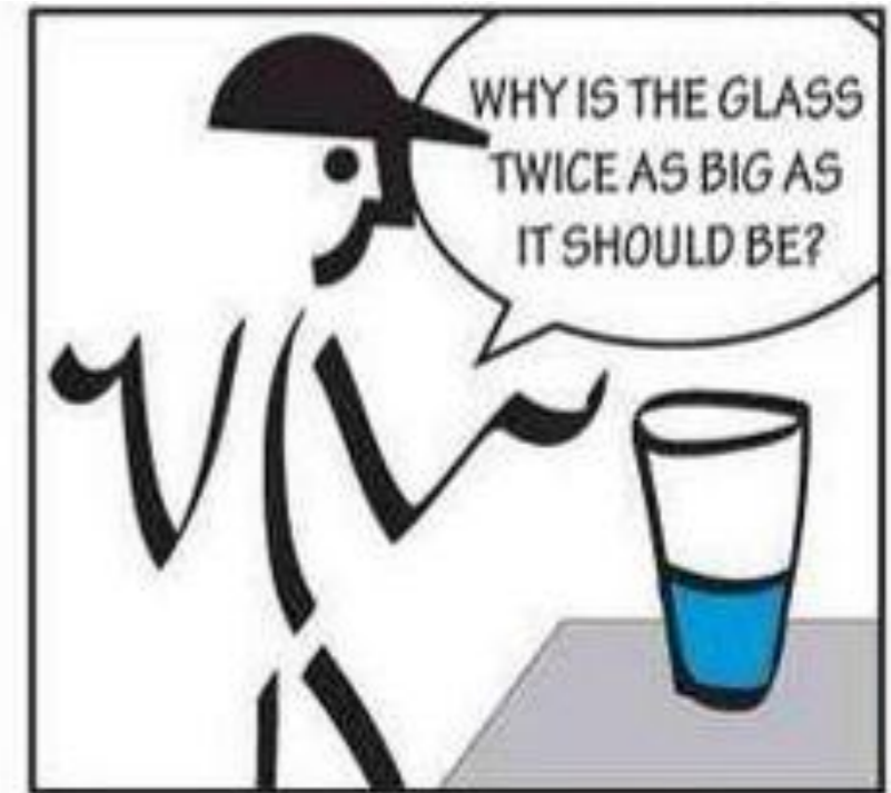
The Lean Thinker